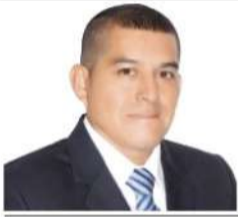
Por: Pablo C. Orbezo Castañeda*

En 205 años del Bicentenario de la Independencia, el debate sobre héroes nacionales invita a los peruanos a cuestionar narrativas. Alberto Fujimori, expresidente (1990-2000), es presentado por algunos como "héroe" por estabilizar la economía y derrotar al terrorismo. Logros como el control de la hiperinflación, la captura de Abimael Guzmán en 1992 salvaron vidas y restauraron la esperanza. Estas acciones de un liderazgo pragmático, merecen reconocimiento respetuoso por su impacto en la pacificación del país, crecimiento y estabilidad económica.