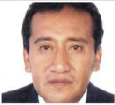
Por: Oscar Vizcarra Hidrogo*

En la actualidad, es recurrente el debate en torno a la eficiencia, eficacia, competitividad y productividad que debe caracterizar al talento humano, tanto en el sector público como en el privado. Estos factores resultan determinantes para garantizar una adecuada prestación de servicios y la producción de bienes con estándares óptimos de calidad y cantidad, orientados a satisfacer las crecientes necesidades de la población.