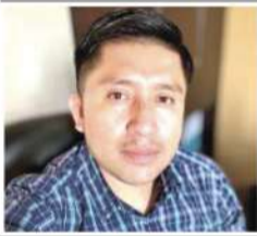
Por: Ing. Miguel F. Mondragón Sandoval*

La rendición de cuentas en el Perú ha dejado de ser un simple requisito administrativo para convertirse en un verdadero termómetro de la gestión pública. Hoy, gracias a la estandarización de la información y al uso de herramientas digitales, ya no basta con declarar acciones: es necesario demostrar resultados.