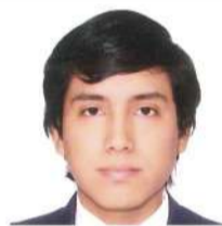
Por: Paul J. Corcuera García*

La discusión sobre política social en el Perú suele girar en torno a programas específicos: si Juntos debiera crecer, si Pensión 65 alcanza, si hace falta un nuevo bono. Pero el problema es más de fondo. El país intenta proteger a su población con un Estado que no recauda lo suficiente y con un mercado laboral donde la mayoría trabaja en la informalidad.