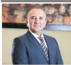
Por: Rubén Carrasco*

Cada 12 de mayo se conmemora el Día Internacional de la Sanidad Vegetal, una fecha que destaca la importancia de proteger las plantas como base de la seguridad alimentaria y del equilibrio ecológico del planeta.