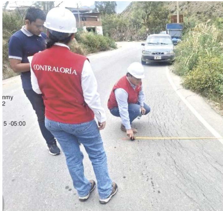
nmy 2 5 -05:00

Se trata de tramo Conchumayo - San Sebastián de Quera en Santa María del Valle