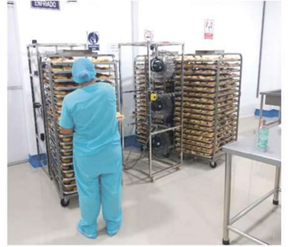
pulación de alimentos durante la elaboración de productos de panificación.

Así como falta Buenas Prácticas de Mani-