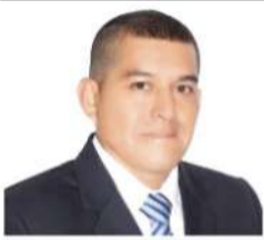
Por: Pablo C. Orbezo Castañeda*