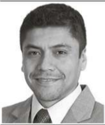
Por: Christian Capuñay Reátegui*

En cada proceso electoral, la fiscalización sobre quienes aspiran a cargos públicos se intensifica. Es natural -y necesario- que la ciudadanía evalúe la trayectoria, las capacidades y la idoneidad de los candidatos. La política democrática no puede renunciar a ese estándar sin debilitarse. Sin embargo, no todo escrutinio es equivalente, ni todos los criterios de evaluación se aplican con la misma neutralidad.