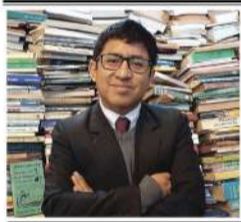
Por: Rubén Quiroz Ávila*

La visión del Inca Garcilaso de la Vega tuvo un impacto que se mantuvo durante siglos. Su triunfo como estrategia radica en que logró la normalización de su enfoque tanto en el imaginario europeo como en el nuestro. Los Comentarios Reales, que fueron un best seller, se convirtieron en una fuente esencial para comprender, imaginar y rastrear los mecanismos de cómo habrían funcionado los incas.