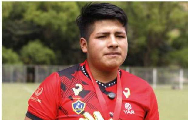
FIGURA DEL CAMPEÓN

Atlético Evza suma un atacante para enfrentar la etapa provincial de la Copa Perú