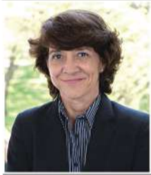
Por: Susana Mosquera*

La actual situación de tensión geopolítica –expresada en el bloqueo del estrecho de Ormuz, la guerra entre Rusia y Ucrania y la escalada de violencia en Medio Oriente– puede percibirse desde el Perú como un problema lejano. Sin embargo, esta idea es equivocada. La experiencia reciente ha demostrado que vivimos en un mundo profundamente interconectado, donde las crisis sanitarias, los flujos migratorios, las disrupciones logísticas y los conflictos armados generan impactos globales. No se trata, por lo tanto, de un problema “de otros” porque afecta también al Perú.