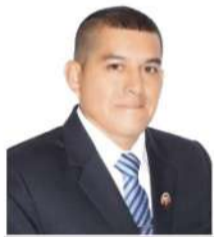
Por: Pablo Cesar Orbezo Castañeda*