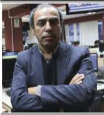
Por: Ricardo Montero*

Al recordar el inicio de esta aventura, me visualizo con apenas cuatro o cinco años tendido sobre la inmensa cama de mis padres, empeñado en la tarea de descifrar la arquitectura de las palabras impresas.