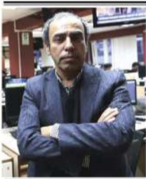
Por: Ricardo Montero*

En esta campaña electoral, los candidatos han volcado gran parte de sus energías en captar el voto joven. Sin embargo, su presencia en las plataformas digitales con mayor presencia juvenil se ha basado en estrategias fallidas, como bailar, cumplir retos de tendencia o narrar recetas de éxito personal, en vez de abordar las demandas reales de esta generación.