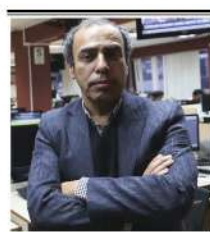
Por: Ricardo Montero*

En un cruce de racionalidades y emociones está transcurriendo una campaña electoral