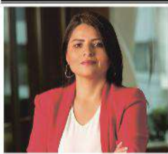
Por: Damary Milla*

La idea de la pena de muerte no solo pone a prueba los límites legales del país, sino también los valores éticos y democráticos que aspiramos defender.