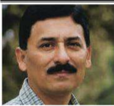
Por: Luis Luján Cárdenas*

La situación en Huánuco es un microcosmos de los desafíos que enfrenta el sistema educativo en todo el país. La falta de docentes y personal de apoyo es un obstáculo significativo para proporcionar una educación de calidad. Este problema no solo afecta el presente, sino que también pone en riesgo el futuro de miles de estudiantes que merecen una educación digna y de calidad.