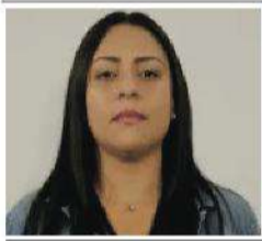
Por: Julianis Caldera Torres*

Dicen que el amor es el motor que mueve el mundo así que... ¡Feliz Día de los Enamorados! ¡Feliz Día de la Amistad! ¡Feliz Día de San Valentín!