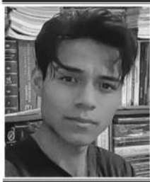
Por: Cristhian J. Ayala

La mítica y aclamada novela del escritor mexicano Juan Rulfo: 'Pedro Páramo', llega este año a la pantalla de Netflix bajo la aguda y tenaz observación del cineasta Rodrigo Prieto (nominado a los premios Oscar en tres ocasiones por su trabajo como fotógrafo), marcando así su debut directoral y su llamado a la industria para próximas colaboraciones con Hollywood. Con esta producción el cinefotógrafo de 58 años busca condenar las murmuraciones (desde luego respetables y a tomarse en consideración), sobre las tipificaciones de algunos, seguros de su erudición, incólumes -es más-, a la hora de enarbolar críticas insidiosas con relación a la idea de que ciertas obras literarias no pueden adaptarse a la pantalla grande sin pecar en el intento. Rodrigo Prieto, sin embargo, coloca la primera piedra y enseña al público conocedor su trabajo televisivo bajo la premisa: "Lo imposible se hace posible cuando hay valentía y decisión". Más allá de sus aciertos o fallos, pues cada uno es digno de interpretar y deducir su ignota observación, la serie busca complacer los paladares menos exquisitos, más no las casquivanas críticas de estudiosos y sabiondos en el tema.