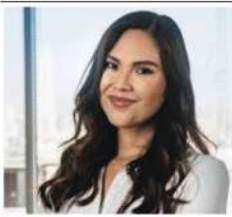
Por: Yuriko Huayana*

La falta de representación femenina en el sector tecnológico es un problema arraigado que ha persistido durante años. De acuerdo con la información de la ONU, todavía las mujeres representan menos del 30% de profesionales en ciencia, tecnología, ingeniería y matemáticas (STEM, por sus siglas en inglés), lo que refleja una marcada disparidad de género en estas disciplinas.