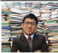
Por: Rubén Quiroz Ávila*

Cada vez que se anuncia un nuevo retiro de los fondos de pensiones administrados por las AFP, estas despliegan en alineación y casi perfecta sincronización que se pone en peligro absoluto el sistema de pensiones, el futuro personal e incluso la existencia de la nación.