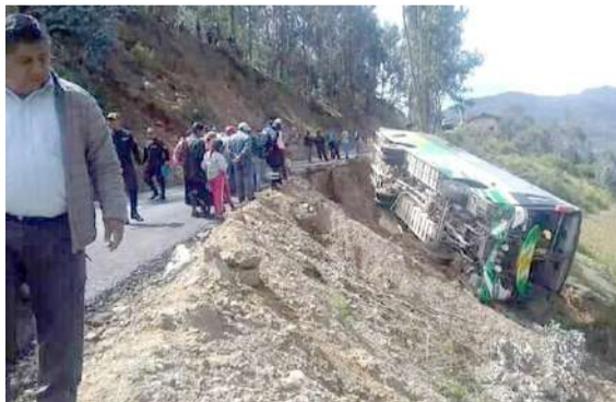
Bus termino volteado a un costado de la carretera

La unidad de placa A9T-957 que era conducida por Iliacer Campos Or-