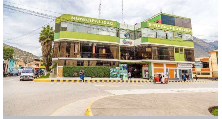
La campaña tributaria permanecerá hasta el 31 de este mes en Amarilis