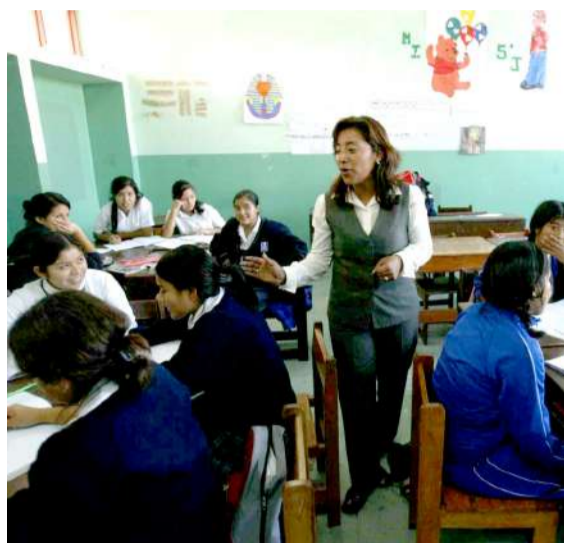
La relación de las plazas está en la web: www.minedu.gob.pe

Lima Metropolitana (10 890) y las regiones de Loreto (9198), Piura (7739), Cajamarca (7118), La Libertad (6879), Cusco (6297) y Junín (5304) son las que cuentan con el mayor número de plazas. En Huánuco, son