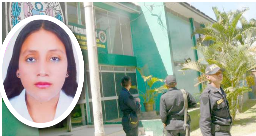
Denuncia de desaparición fue presentada en el Departamento de Investigación Criminal