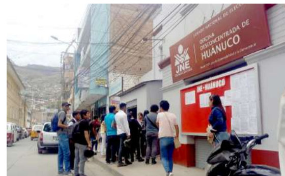
Aspirantes a fiscalizador protestan

Un grupo de ciudadanos que pretendían ser fiscalizadores en el actual proceso electoral bajo la convocatoria del Jurado Electoral Especial (JEE) de Huánuco, denunciaron cambio de horario en la recepción de documentos.