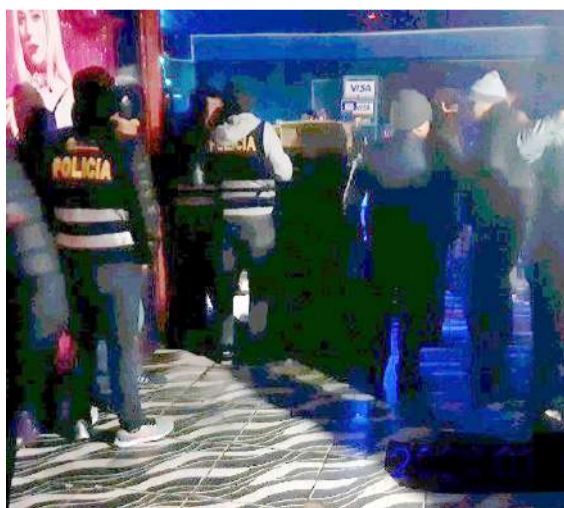
Redada policial para rescatar a una adolescente