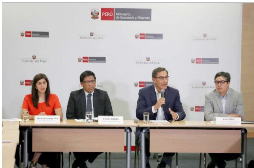
Martín Vizcarra participó de cita con alcaldes de Red de Municipalidades

El presidente de la República, Martín Vizcarra Cornejo, destacó la importancia de que en el presente año los municipios efectúen un esfuerzo para ejecutar más del 80% de su presupuesto de inversión con el fin de lograr el desarrollo de sus pueblos y cerrar brechas sociales.