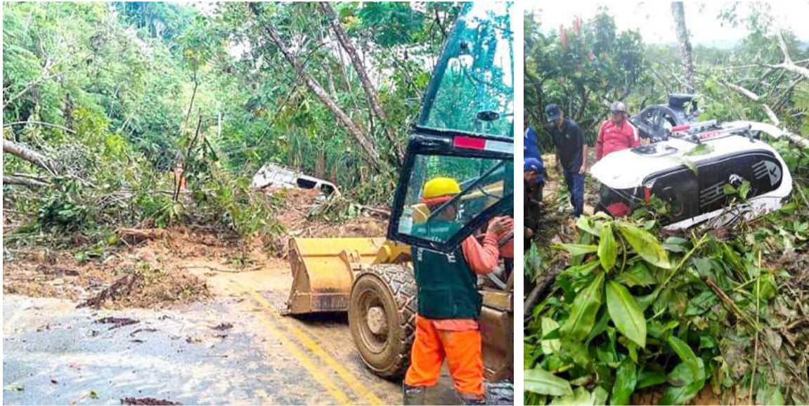
Maquinarias limpiaron la vía para reestablecer el tránsito

El deslizamiento de tierra y árboles bloqueó por unas horas el kilómetro 484 de la carretera Fernando Belaúnde Terry, jurisdicción del distrito de Pueblo Nuevo, provincia de Leoncio Prado. Cuatro vehículos que al momento de la emergencia circulaban por la vía fueron alcanzados por la furia de la naturaleza y quedaron atrapados entre lodo y ramas de árboles. Una pobladora que pasaba por el lugar resultó con leves lesiones y fue tras-