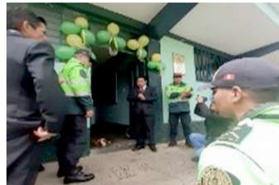
Puesto de Auxilio Rápido en Pachas