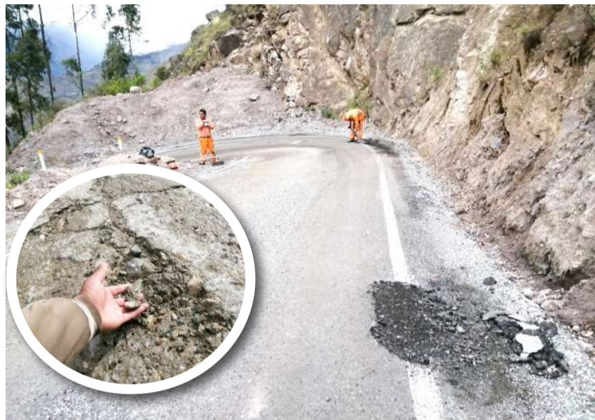
Así luce la construcción de la millonaria carreteras que aún no es inaugurada

go, Desde la Torre pudo comprobar que a pocas semanas de concluido la capa asfáltica, pintado y señalización de la vía entre el tramo Carpa (Tantamayo) a Huampoy (Arancay) existen varios puntos que ya presentan deterioros significativos que hacen suponer la mala calidad de la obra y un deficiente trabajo de la empresa CASA responsable de la