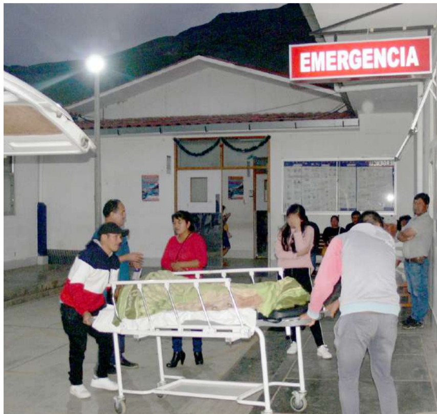
Heridos fueron evacuados al hospital de contingencia del Hermilio Valdizán

de la tarde ocurrió el accidente de tránsito que dejó a 4 miembros de una familia herida