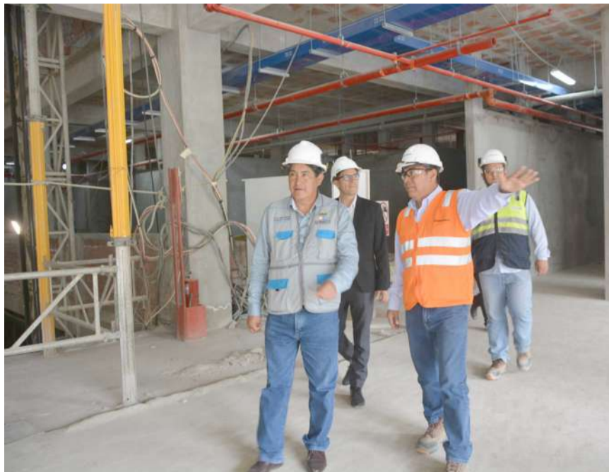
Construcción del Hospital Hermilo Valdizán continúa sin supervisor