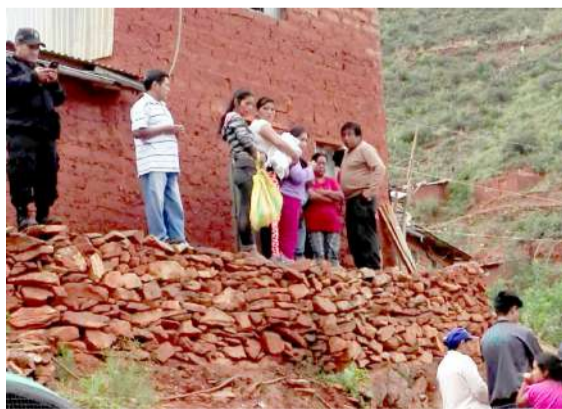
Anciano decidió acabar con su vida ahorcándose

Según sus familiares, la joven tras desayunar con sus padres fue a su habitación para tomar el veneno. Cuando sus parientes echaron de me-