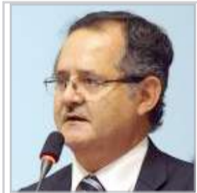
Marco Tulio Falconí Picardo

del Pueblo. Recibió el Premio por la Paz 2015 categoría Estado del Ministerio de la Mujer y Poblaciones Vulnerables.