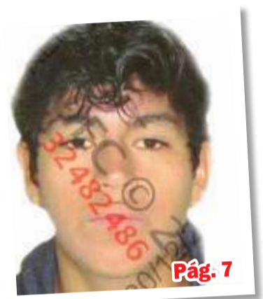
Cae implicado en el homicidio del profesor Ernesto Minaya