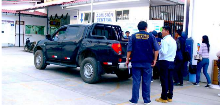
Diligencia de levantamiento de cadáver fue realizada en la morgue del hospital

Pese que en el lugar existe cámaras de seguridad asignadas a la municipalidad de Pillco Marca, no existen imágenes del hecho debido que dichas máquinas están malogradas desde hace varios meses hecho que dificulta a la policía identificar al autor