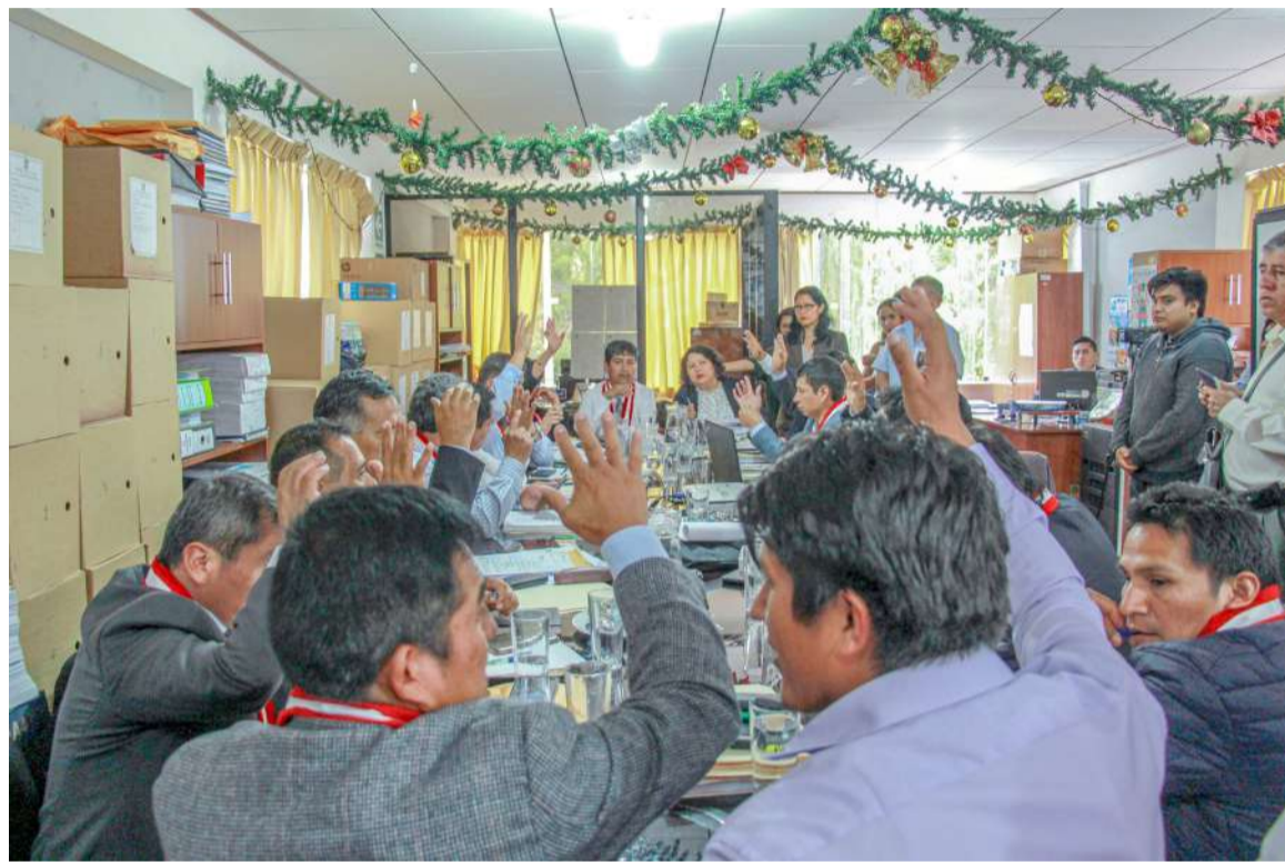
El proyecto de presupuesto fue aprobado en el Consejo Regional

S/ 204'881,224.00 que significa 57'430,901.00 menos. La considerable reducción de un 21.89% preocupó a los consejeros regionales a quienes la gerente de presupuesto les indicó que el tres de enero en el primer Gore Ejecutivo buscarán financiamiento de los proyectos que no han sido