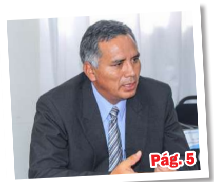
Representante de Lauricocha es el nuevo consejero regional delegado