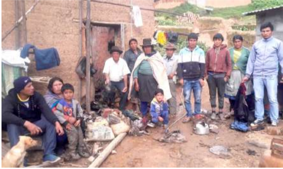
Familia se quedó prácticamente en el aire tras el incendio