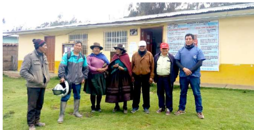
Dirigentes y profesionales de salud dan a conocer la caótica situación

Al frente del establecimiento hay una ambulancia en buenas condiciones que