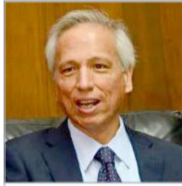
Aldo Vásquez Ríos

Es abogado y magíster en periodismo por la Universidad de San Martín de Porres, y doctor por la Universidad Complutense de Madrid. Fue ministro de Justicia y Derechos Humanos durante el gobierno de Ollanta Humala.