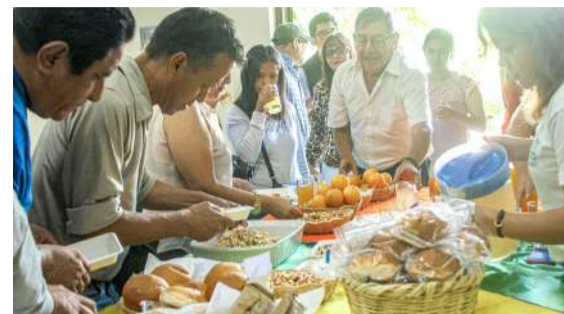
Actividades fueron anunciadas en conferencia

“Una Alimentación Sana para un Mundo sin Hambre”, es el lema del Día Mundial de la Alimentación a celebrar el 16 de octubre. Ayer, la Dirección Regional de Agricultura (DRA), anunció las actividades que desarrollarán en Huánuco con ese motivo desde el 13 de octubre.