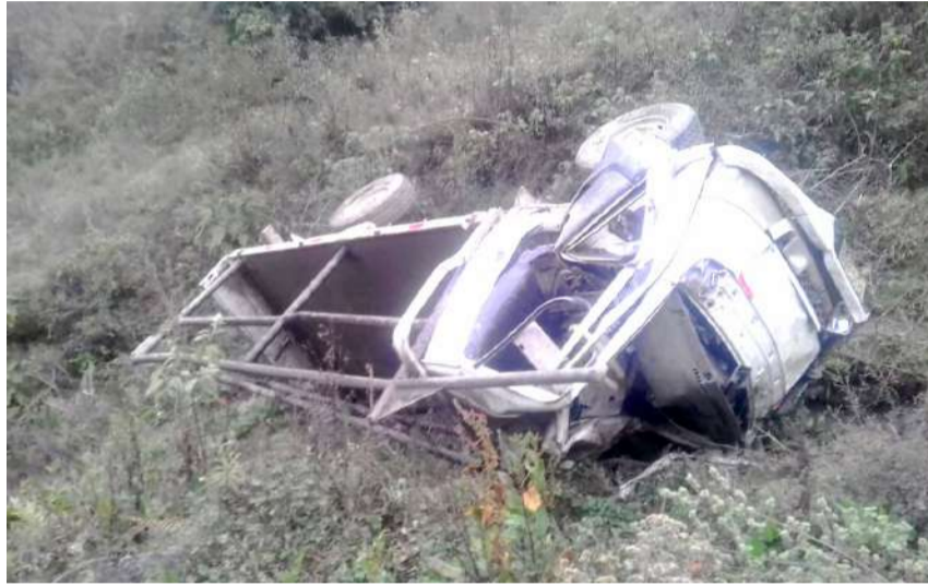
Camión quedó inoperativo tras rodar por el cerro en la vía Huánuco La Unión

M iércoles trágico. Un muerto y un herido es el resultado de un nuevo accidente de tránsito ocurrido en el kilómetro 32+900 de la carretera Huánuco La Unión, altura del poblado Las Pampas. Las causas del despiste y volcadura del camión blanco asignada a la empresa Canton que presta servicios de subcontrata a la compañía China Railway 20 Bureau Group Corporation (encargada de ejecutar el proyecto de mejoramiento, conservación y operación del corredor vial), son investigadas por