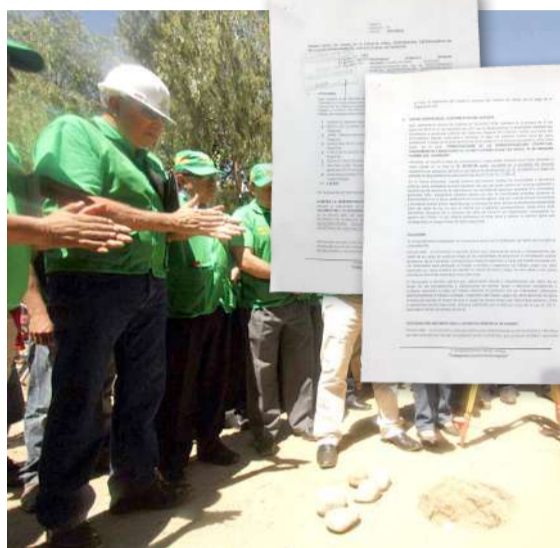
Denuncia fue interpuesta ante la Fiscalía Anticorrupción

La denuncia está basada en el informe de la auditoría ejecutada al periodo del 01 de enero 2013 al 31 de diciembre 2017, en el que hay observaciones al desempeño de funcionarios y servidores de la