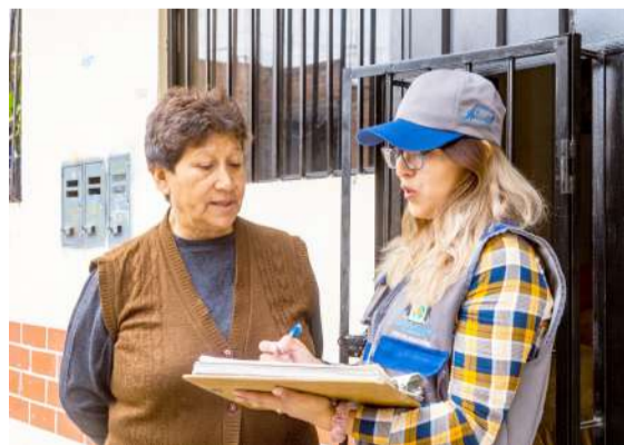
Hasta diciembre habrán facilidades

“Durante el último trimestre del año convocamos a los vecinos para pagar sus arbitrios y ayudarnos a continuar