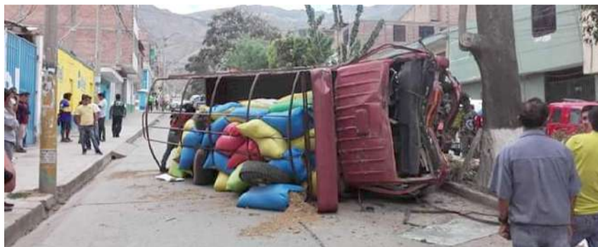
Vehículo terminó volteado en medio de la pista en la Alameda

lo que siguió su recorrido sin poder controlar el vehículo que chocó con un árbol para luego terminar volteado en medio de la pista.