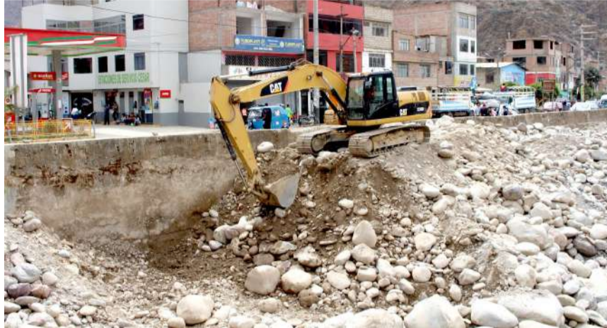
Trabajos iniciaron a la altura del puente Huancapata

partes bajas afectadas por las crecidas del río Huallaga en marzo de este año.