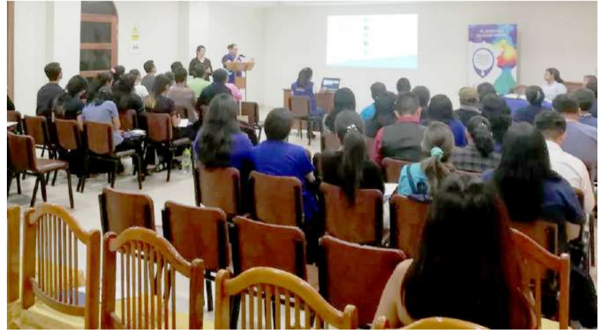
Defensoría del Pueblo presentó ayer un informe sobre el tema

Las brechas de financiamiento para la salud