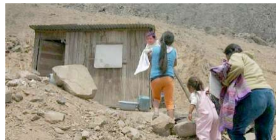
Tema la pobreza será analizada en Huánuco

Los avances y retos en la agenda de la lucha contra la pobreza y vulnerabilidad, desde sus múltiples dimensiones, serán abordados por autoridades gubernamentales, representantes del sector público y privado, académicos, organismos internacionales, así como de la sociedad civil durante la ‘VIII Semana de la Inclusión Social’, actividad organizada por el Ministerio de Desarrollo e Inclusión Social (Midis) y que se desarrollará del 14 al 18 de octubre en Huánuco.